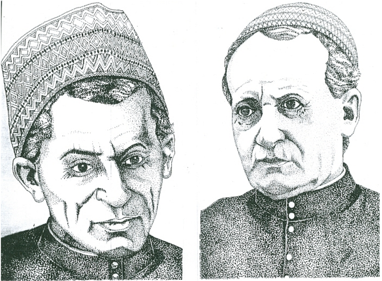
Altro disegno di João Torkio. L'Allamano e il Camisassa portano un copricapo di stile locale.