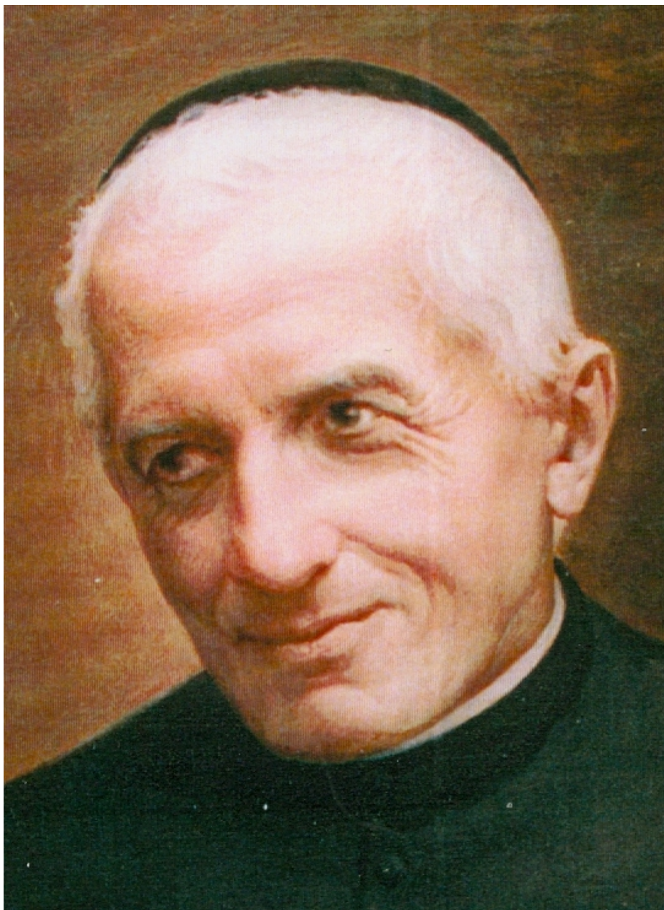
Da particolare del volto si nota che l'autore si è ispirato ad una fotografia del 50° di sacerdozio dell'Allamano.